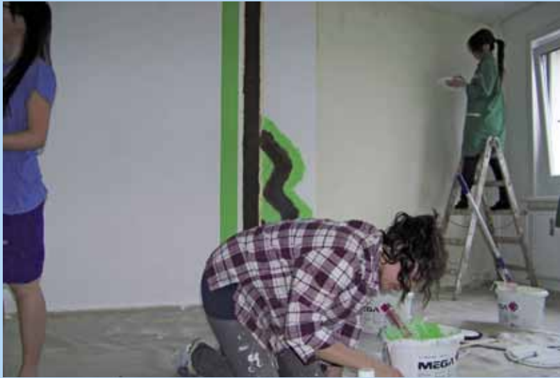
Malerinnen bei der Arbeit

Nach all der Vorbereitung begannen endlich die Arbeiten in der Musterwohnung. Gemeinsam mit den Lehrerinnen stellten die Schülerinnen und Schüler selbständig einen Arbeitsplan auf. In zwei Kursblöcken war das Malern der Räume und der Aufbau der Möbel zum geplanten Termin nicht zu schaffen. So wurde Unterricht verlagert, aber größtenteils arbeiteten alle in ihrer Freizeit in der Musterwohnung. Zunächst besprachen die Gruppen mit einem Malermeister, welche und wieviel Farben sie benötigen.