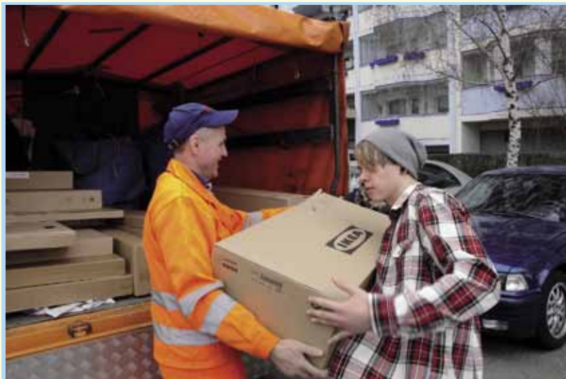
Lieferung mit Unterstützung eines Vaters

Eine frühe Idee dieses Projektes bestand darin, die von Schülerinnen und Schülern gestaltete Wohnung als Musterwohnung für Wohngemeinschaften zu nutzen. Dazu musste sie allerdings vollständig möbliert sein. In Vorbereitung der praktischen Arbeiten wurden dazu neue Gruppen gebildet, der Anzahl der zu gestaltenden Räume entsprechend. Als erste Aufgabe galt es, Möbel zu finden, welchen den Entwürfen entsprachen. Für jeden Raum wurde von den Wohnungsunternehmen die Summe von 500 Euro zur Verfügung