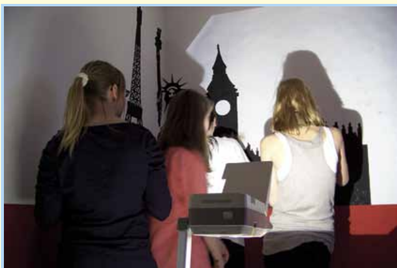
Eine Wand voller Motive

spreche. Die Wohnungsunternehmen zeigten großes Interesse, junge und Erstmieter für das Wohnen in einer Mietwohnung zu qualifizieren. Die Akteure des Projektes „Wohnführerschein“ hatten sich gefunden. Im Quartier ist die Tagore-Schule, ein Gymnasium, ansässig. Auf das Projekt angesprochen, fanden sich schnell zwei Kunst-Leistungskurse der 11. Klassen, welche das Thema Architektur behandeln wollten. Die Schülerinnen und Schüler entschieden sich, am Projekt teilzunehmen. So waren auch die Adressaten des