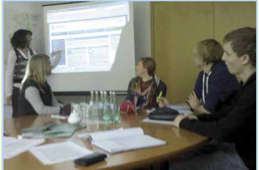
Wo finde ich eine Wohnung?

per Zeichnung bebildert. Daraufhin spielten die Schülerinnen und Schüler die Rollen für die Fotostory selbst und wurden von einer Mitschülerin kundig fotografiert. Abschließend entwarf die Gruppe einen Test, der am Schluss der Fotostory Auskunft geben würde, ob der Leser alle Inhalte richtig aufgenommen hat. Als weiteres Exponat fanden Fotostory und Test viel Interesse und Zuspruch während des Schulfestes.