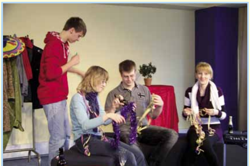
Szene aus dem ersten Fotoshooting Werbung

5-Raum-Wohnung aus. Der Moderator begleitete das Projekt durch alle Phasen hindurch und nahm sich zunächst besonders der Themen Wissen ums Wohnen und zielgruppenorientierte Werbung an. Schon die Eingangsbefragung des gesamten Kurses ergab einen erstaunlichen Realitätsbezug der Schülerinnen und Schüler bei deren Vorstellungen von erster und Traumwohnung.