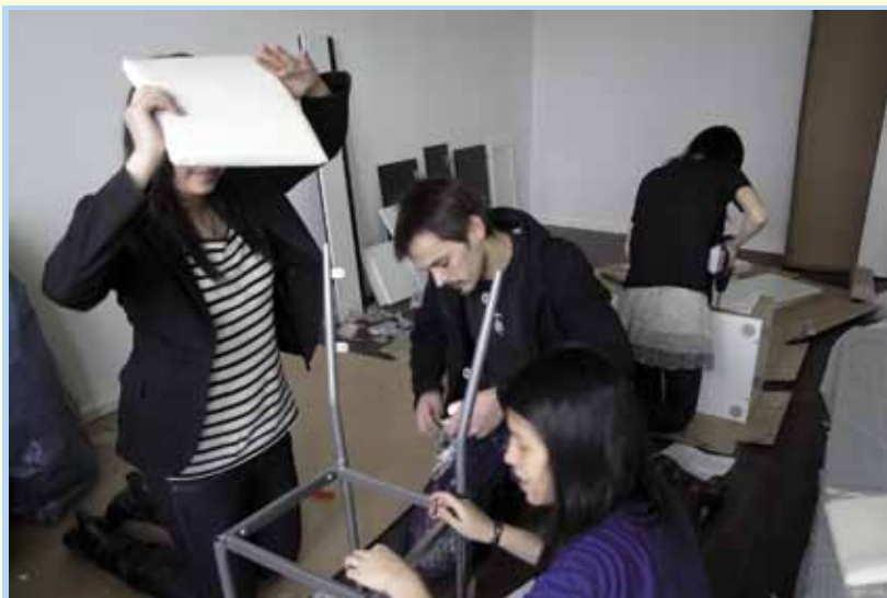
Möbelaufbau mit Unterstützung

Wie geht eigentlich Wohnen? Wir glauben es zu wissen und sind ausreichend von Hinweisen umgeben, richtig zu wohnen. Doch woher stammt dieses Wissen? Und wer gibt es an die Jugend weiter? Man meint, solche Aufgaben gehören in die Eltern-Kind-Beziehung. Manche Eltern verweisen erstaunt auf die Schule. Im Lehrplan unserer Schulen aber wird man das Thema Wohnen bisher nicht finden. Das kann sich nun ändern. Es gibt jetzt einen Wohnführerschein.