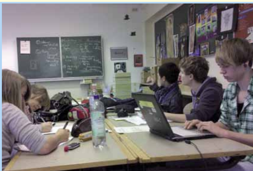
Szenaristen bei der Arbeit - die Fotostory entsteht