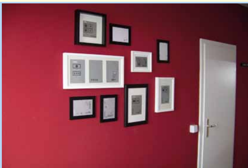
Wandgestaltung für Kulturinteressierte

periment teil. Was würden die Wohnungsunternehmen über zukünftige Jung-Mieter erfahren? Welche Vorstellungen haben die jungen Menschen von ihrer ersten Wohnung? Wo lauern Konflikte, wie vorhersehbar sind sie? Wie würde eine von den Schülerinnen und Schülern selbst gestaltete und eingerichtete Wohnung aussehen? Heute kann man sagen, die Ideen und die Kreativität der jungen Leute haben alle überrascht, vielleicht auch sie selbst. Diese Einleitung darf nicht geschlossen werden, ohne das große Engagement der beteiligten