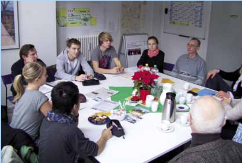
In der Expertenrunde

Die eigentlichen Inhalte zum Lehrprogramm des „Wohnführerscheins“ zu recherchieren war die Aufgabe der gleichnamigen Gruppe. Zunächst stellten die Schülerinnen und Schüler gemeinsam mit den Fachfrauen der Wohnungsunternehmen ihren Fragenkatalog zusammen. Die Ergebnisse der Erstbefragung flossen hier genauso ein wie Situationen, die den Schülerinnen und Schülern als relevant für eine eigene Wohnung erschienen. Ihre Recherchen führte die Gruppe hinaus an die Orte des tatsächlichen Geschehens. Ein Bau-