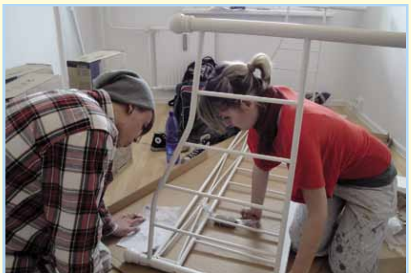
Der zweite Blick in die Aufbauanleitung

Mit der Lieferung der Möbel begann eine ganz andere Arbeit. Die große Wohnung stand voller Kartons, ungläubige Augen richteten sich auf Aufbauanleitungen, auf Akkuschrauber und Bohrmaschinen. Gemeinsam mit einem versierten Möbeltischler meisterten die Gruppen auch diese Herausforderung.