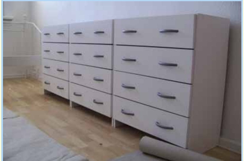
Jede einzelne Schublade braucht Zeit

Der kleine Makel dieser Konstellation, nämlich dass es noch gar kein Kursprogramm gab, erwies sich bald als Vorteil. Bestand doch die Aufgabenstellung darin, gemeinsam mit den Schülerinnen und Schülern genau diesen Kurs erst einmal zu entwickeln. Aus dem Projekt wurde ein Pilotprojekt, in welches die Schülerinnen und Schüler ihre Sprache, ihre Vorstellungen und ihr Ausgangswissen einbrachten. Alle Beteiligten nahmen an einem spannenden Ex-