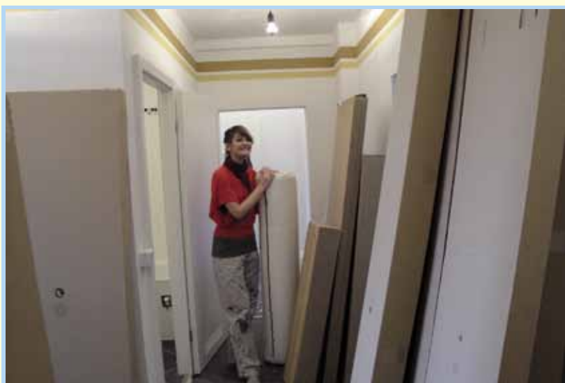
Eine Wohnung voller Möbel - im Karton

gestellt. Die Schülerinnen und Schüler recherchierten in Katalogen, im Internet und direkt in umliegenden Möbelhäusern. Darauf stellten sie ihre Einkaufslisten dem gesamten Kurs und den Fachfrauen der drei beteiligten Wohnungsunternehmen zur Diskussion. Gingen doch die Ansichten zur alltagstauglichen Möblierung ein wenig auseinander. Die limitierten Mittel zwangen zur Entscheidung: ist ein Lattenrost nötig oder doch lieber eine Diskokugel? Was braucht ein Zimmer wirklich, um sich darin wohlfühlen? Schnell lernten alle, dass IKEA nicht immer das günstigste