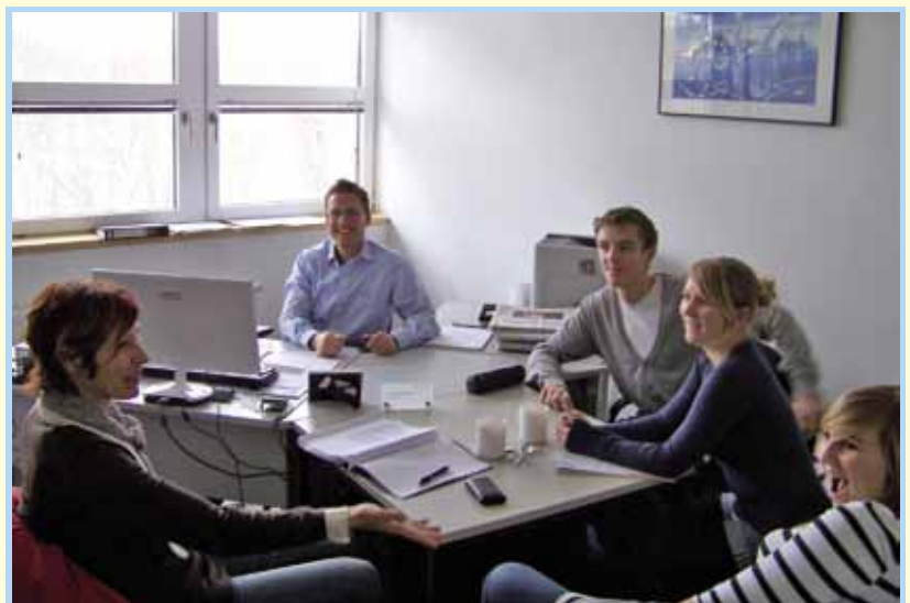
Gute Laune beim Bauingenieur

für alle bis dahin keine Rolle. Stolz über ihr Wissen wies die Gruppe nun ihre Mitschüler darauf hin, dass ein geplantes Wasserbett danach erst einmal berechnet werden müsse. Viel Raum nahmen die Diskussionen um die Wissensvermittlung an Gleichaltrige ein. Schließlich entschloss sich die Gruppe, eine Fotostory anzufertigen, welche die wichtigsten Vorkenntnisse für die erste eigene Wohnung weitergeben würde. Unter Anleitung des Moderators wurde ein Szenarium entworfen, einzelne Szenen ausgearbeitet und