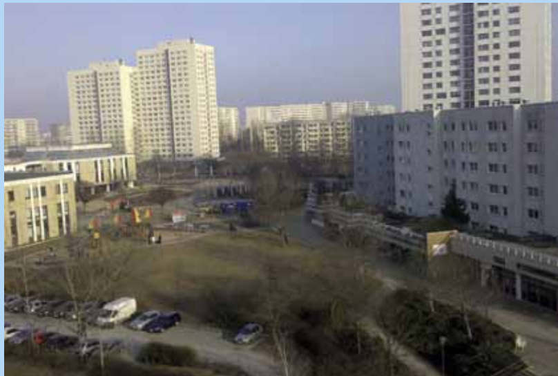
Blick auf Marzahn aus dem Fenster der Musterwohnung

Über das beteiligte Quartiersmanagement wurde das Pilotprojekt im Internet ausgeschrieben. Die Bewerber präsentierten ihre Konzepte vor den Initiatoren und hinzugezogenen Fachleuten. „Lebenswissen vermitteln“ überschrieb das schließlich beauftragte Team aus Sozialwissenschaftlerin, Sozialpädagogin und einem im Immobilienmarketing erfahrenem Moderator seinen Konzeptentwurf. Dabei war das Pilotprojekt schon über den eigentlichen Auftrag, nämlich ein Kursprogramm für künftige Teilnehmer zu schaffen, hinaus-